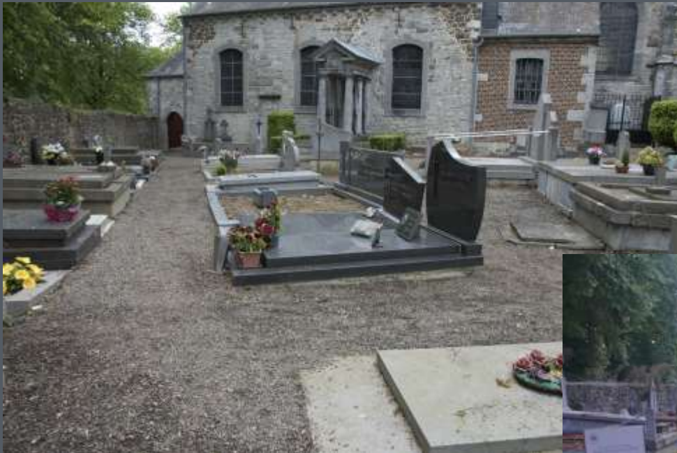
Fleurissement Le cas des cimetières