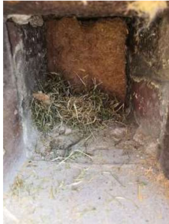
Stuk isolatie en stro/hooi voor eventueel nest