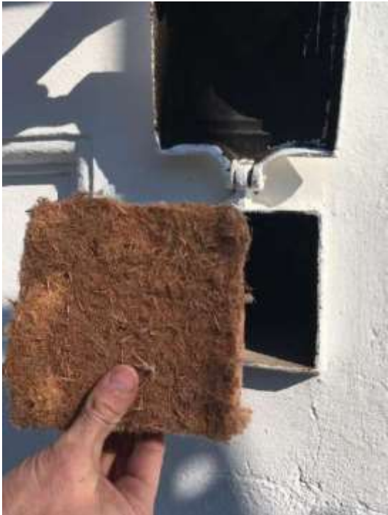
Voorgesneden stuk houtvezel om achterkant te isoleren